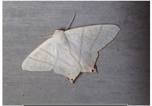
ウスキツバメエダシャク♂