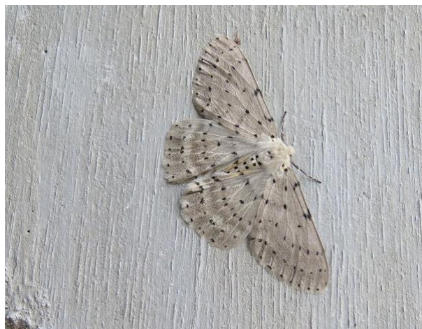
ウスゴマダラエダシャク ♀