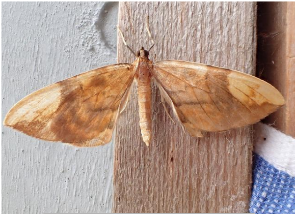
キマダラオオナミシャク♀