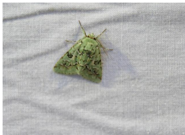
ケンモンミドリキリガ ♀