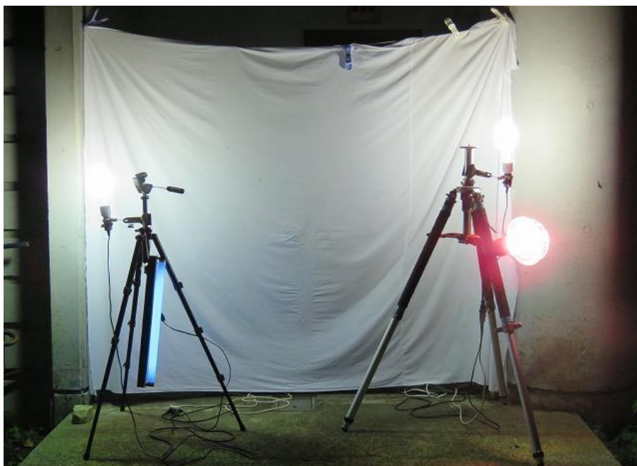
ライトトラップの様子（10月18日18:00）