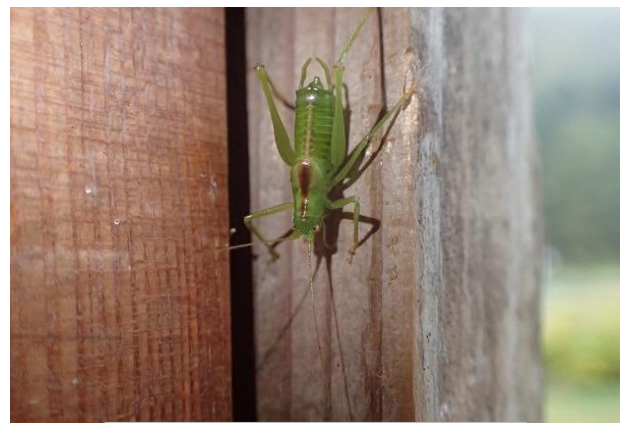
キタササキリモドキ♂