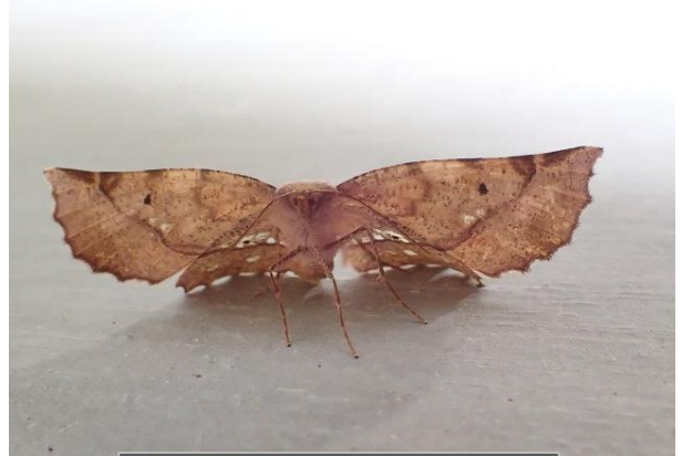
キバラエダシャク♀