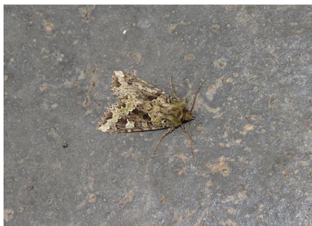
アオバハガタヨトウ ♂