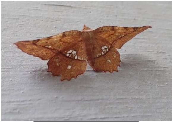
キバラエダシャク♀