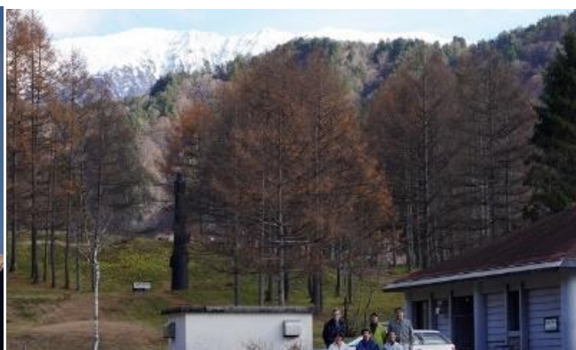
ありがとうございました。令和3年スタッフ6名