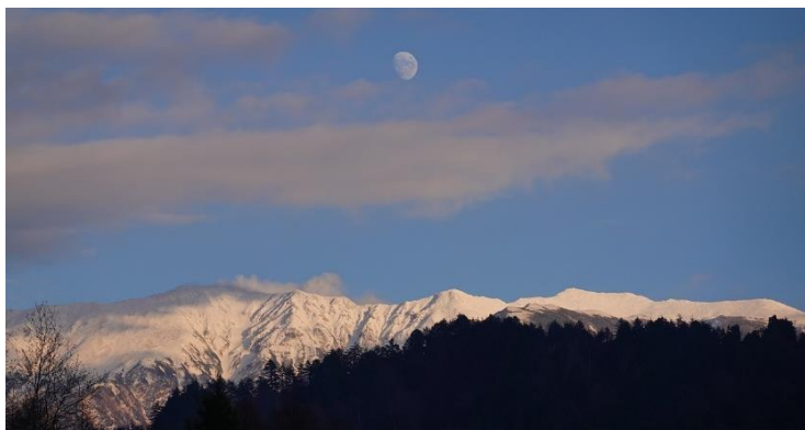
11月15日夕刻 月が薬師岳から昇ってきました。