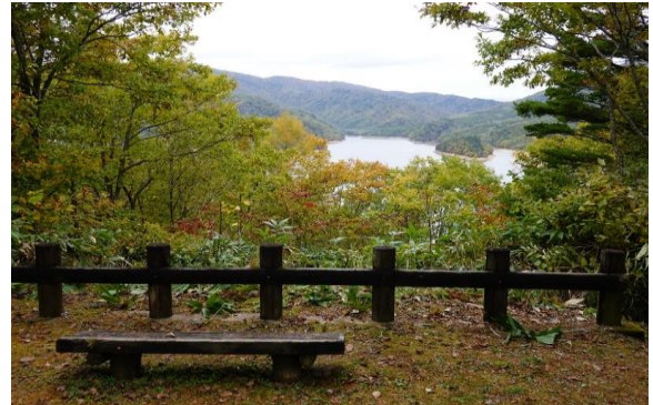
砥谷半島展望台: 笹や灌木で宝来島がよく見えません → 約20分草刈りをしました。視界良好です。