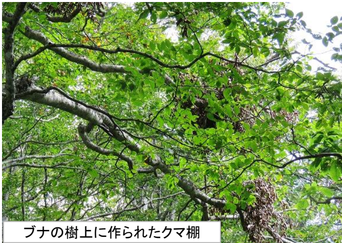
ブナの樹上に作られたクマ棚