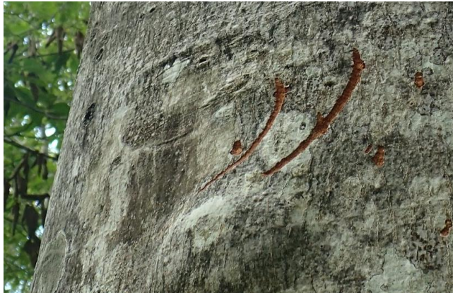
今秋につけられた爪痕 ブナの幹