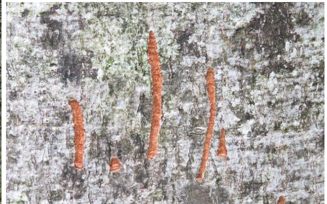
新しい爪痕が残るブナの幹