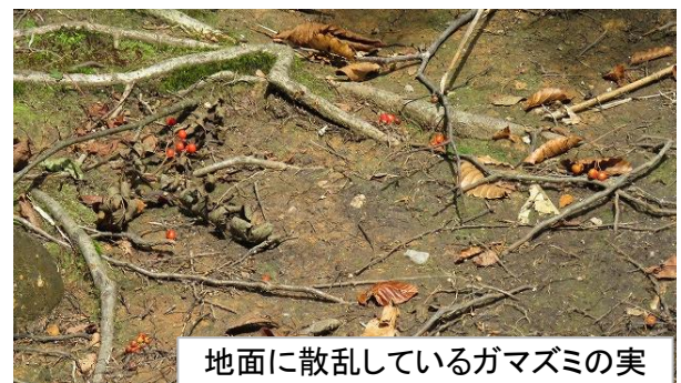
地面に散乱しているガマズミの実