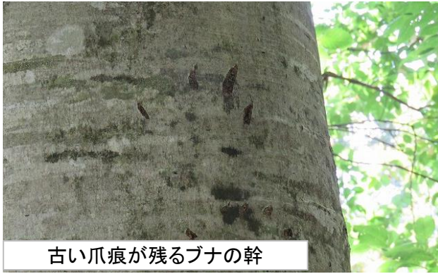
古い爪痕が残るブナの幹