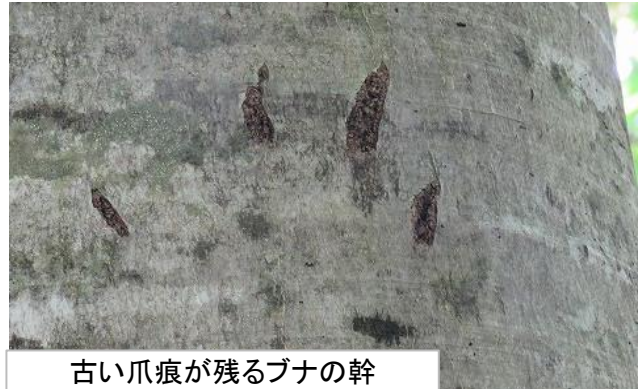
古い爪痕が残るブナの幹