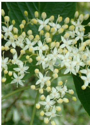
花弁は4枚・雄しべは4本・ めしべ1本 撮影2021/6/23