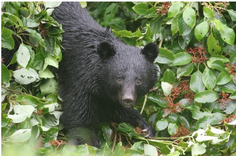
ツキノワクマの夏の重要な食料 撮影2021/8/10/13:50