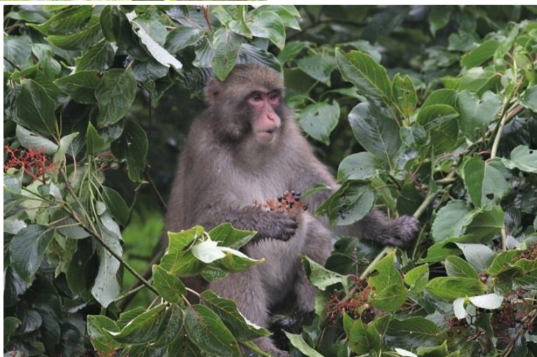
サルにとっても重要な食料 撮影2021/8/10/16:30