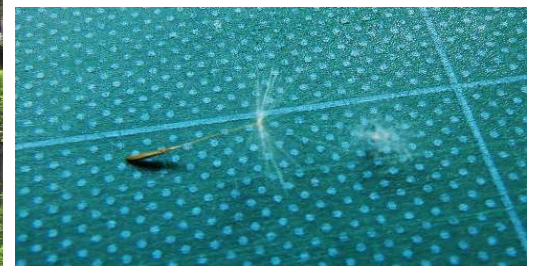
セイヨウタンポポ(左)との比較