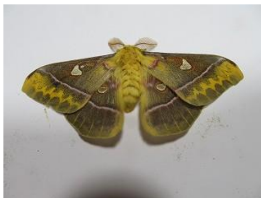
飛来したクロウスタビガ♂