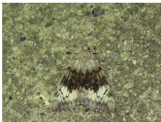
飛来したゴマシオキシタバ♂ カモフラージュをしているように静止