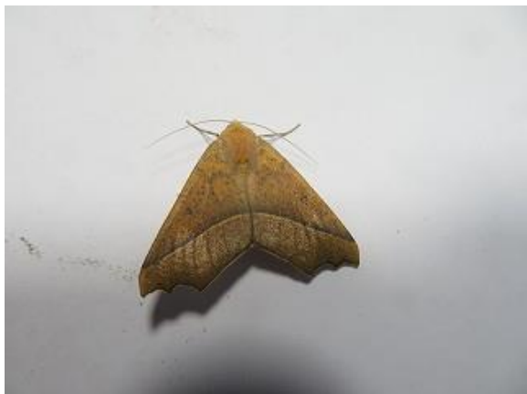
飛来したエグリツマエダシャク♂