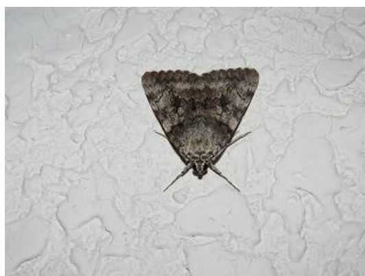
飛来したゴマシオキシタバ♂