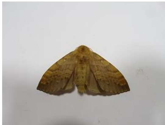
飛来したクヌギカレハ♀