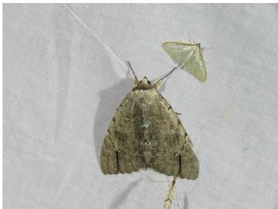
飛来したシロシタバ♂