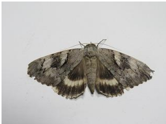
飛来したオオシロシタバ♂