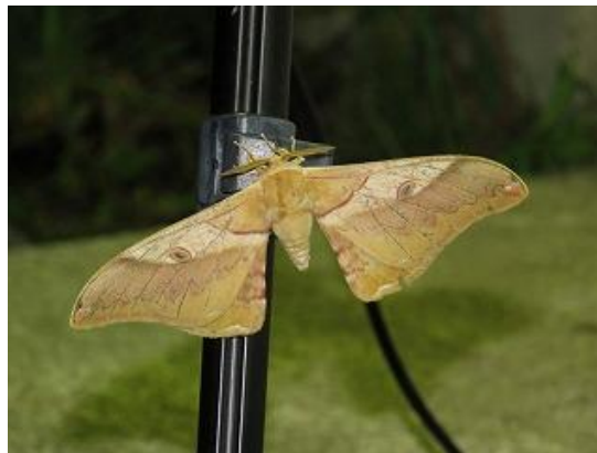
飛来したクシサン♂