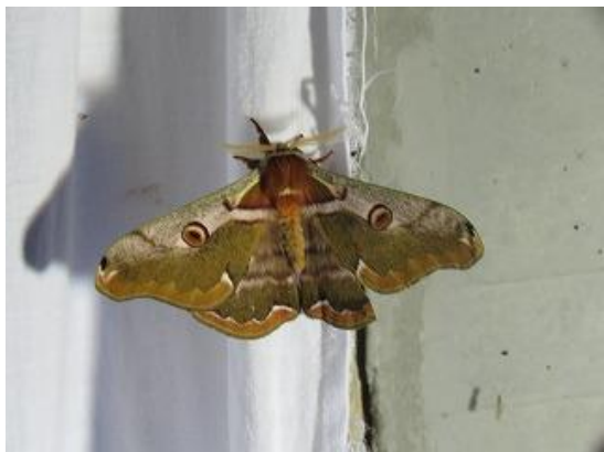
飛来したヒメヤママユ♂