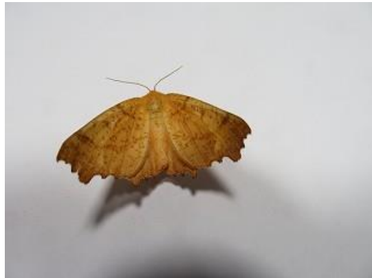
飛来したキリバエダシャク♂