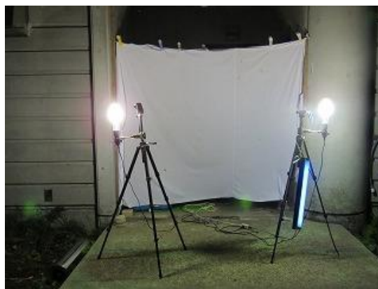
ライトオン直後のライトトラップの様子