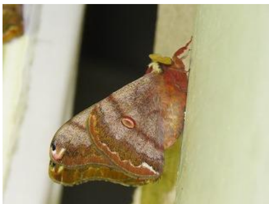
飛来したヒメヤママユ♂