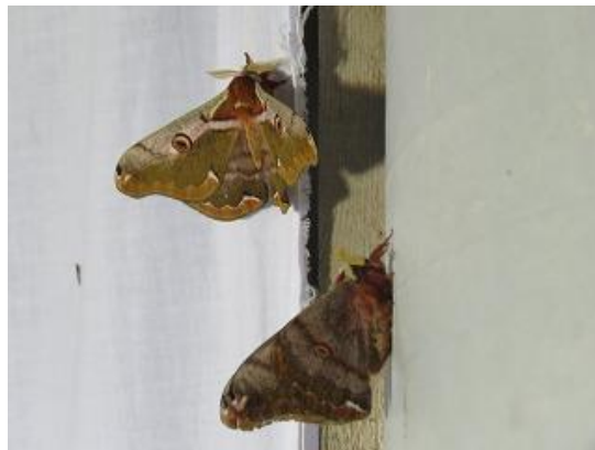
飛来したヒメヤママユ♂